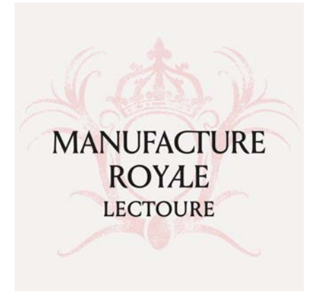
MANUFACTURE ROYALE DE LECTOURE - Identité visuelle