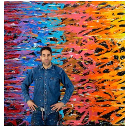
GECINA - Exposition Jonone Mécénat « Un immeuble, une œuvre »