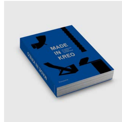
GALERIE KREO - Direction d'ouvrage Livre anniversaire « 20 ans » de la galerie