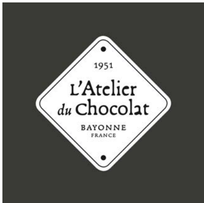
L'ATELIER DU CHOCOLAT Direction artistique et création de la nouvelle charte