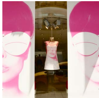
COURRÈGES Direction artistique et scénographie des vitrines