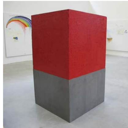
YSL BEAUTÉ - Partenariat artistique Fabrice Hyber, production de l'œuvre 1 m 3 de Beauté