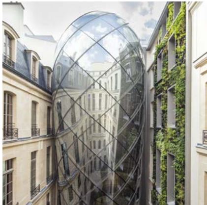
L'ORÉAL - Le Visionnaire Espace d'histoire et d'innovation du Groupe L'Oréal