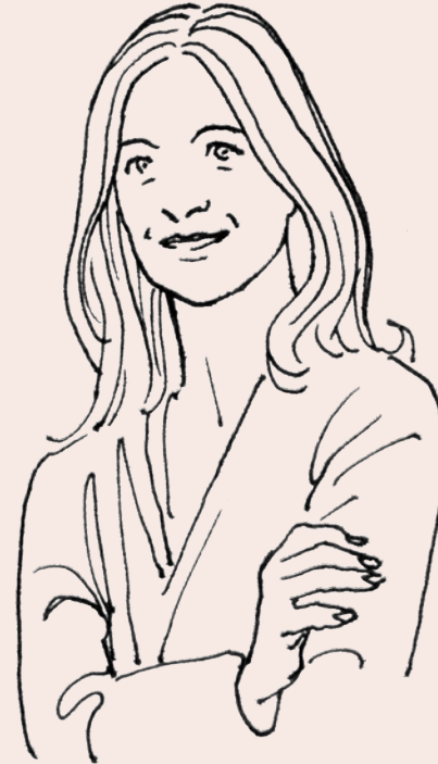
SABINE PINATTON Concepts et contenus

À travers ce regroupement de talents, Anamorphose élabore pour chaque projet une stratégie sur-mesure pour aider votre marque à sortir des sentiers battus.