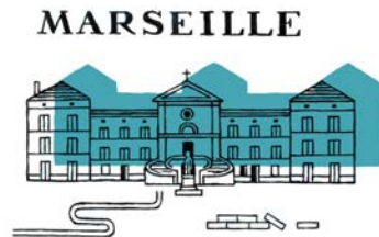
HÔPITAL SAINT JOSEPH - Marseille Exposition L'Hôpital Saint Joseph : 100 ans de médecine